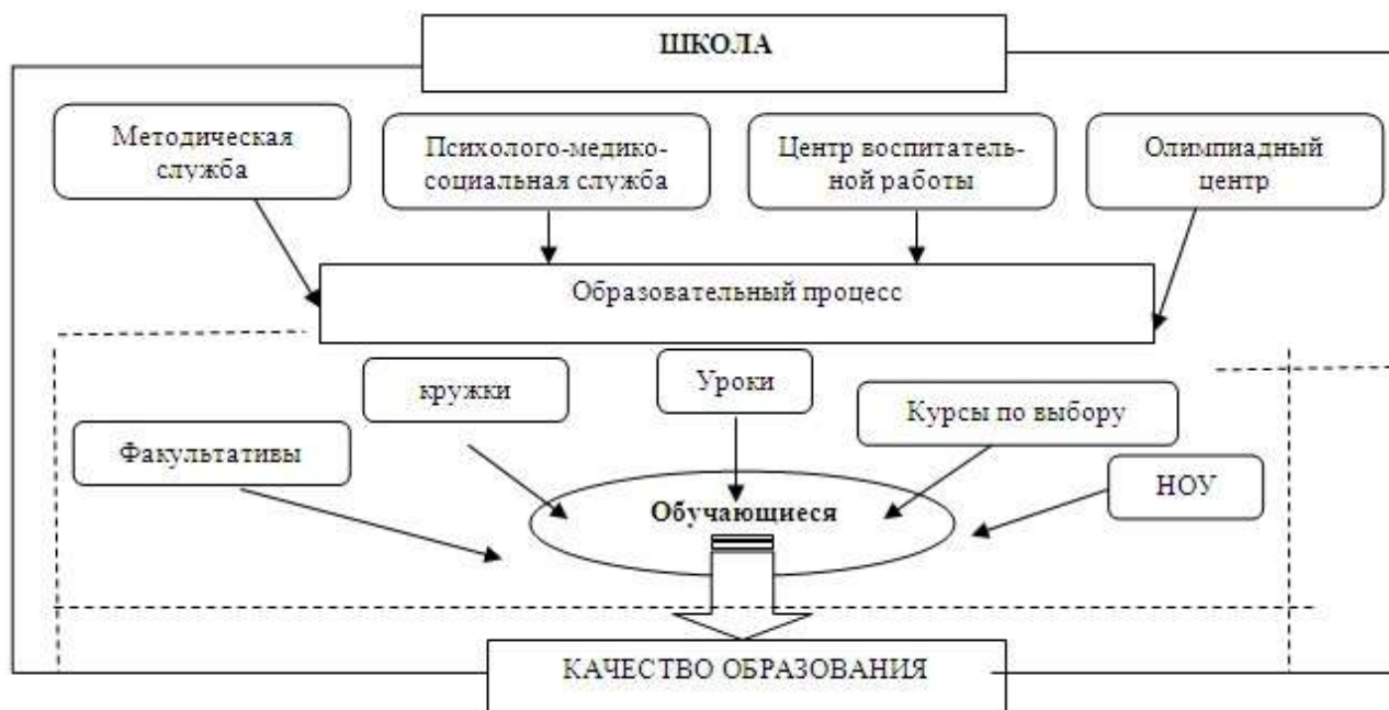
Рис. 1. Образовательное пространство школы